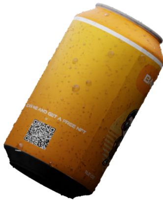
图4 (早期原型)。扫描条形码以接收NFT

在Solana区块链的激动人心领域中, 同质化代币 (NFT) 已经成为一种强大的工具, 使独特的数字资产变得栩栩如生。就BABYSOL而言, NFT在实现教育功能方面扮演了关键角色