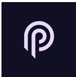
图3: 我们通过PYTH网络的去中心化预言机制获得BabySOL的最新价格信息

购买饮料时, 用户只需将他们的SOL钱包连接到我们的网站。与流行的Solana钱包提供商 (如Phantom、Sollet和Solflare) 的集成, 使用户能够在平台内管理他们的BABYSOL代币并进行购买。