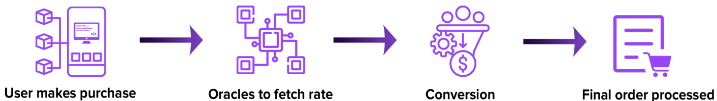
图2: 客户端到服务器端。购买饮料的过程